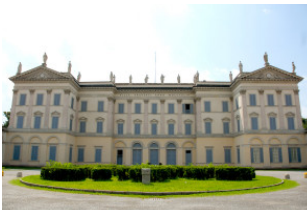
Villa Tittoni a Desio