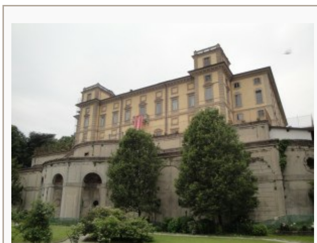
Villa Crivelli Pusterla a Limbiate

Il Sistema delle Ville Gentilizie, che ha preso avvio anni fa e ha avuto impulso grazie a Regione Lombardia ed a Fondazione Cariplo , in occasione di EXPO propone ora nuove e durature occasioni e modalità di visita dei beni, con conseguente valorizzazione dell'intero territorio.