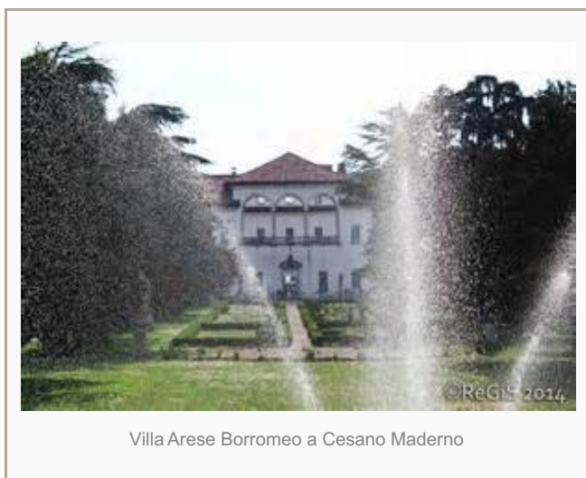
Villa Arese Borromeo a Cesano Maderno

Prezioso in questa ottica il contributo dei nuovi partner: il Touring Club Italiano con i suoi circa 50 Volontari per il Patrimonio Culturale selezionati nell'ambito del progetto 'Aperti per voi', che ogni settimana a partire dal primo maggio stanno donando oltre 100 ore di presenza e affiancheranno le guide volontarie delle associazioni locali nell'accoglienza dei visitatori per tutta la durata per progetto; l'Istituto di Storia dell'Arte Lombarda – ISAL, che ha offerto la sua collaborazione scientifica nella preparazione dei nuovi contenuti multimediali basati su "QR code", che andranno a inserirsi lungo i percorsi turistici appositamente studiati e in fase di ultimazione.