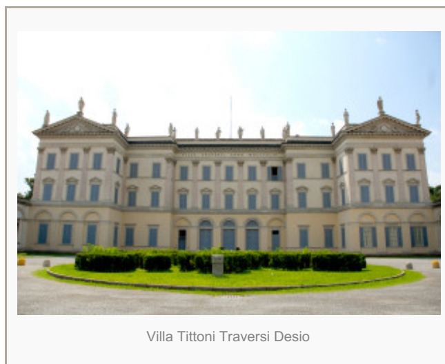
Villa Tittoni Traversi Desio