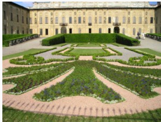
Bollate Villa Arconati

magnificenza di questi complessi: nell'estate del 1750 Villa Arconati ospitò il padre della commedia italiana, Carlo Goldoni, che godeva dell'ammirazione e della protezione di Giuseppe Antonio Arconati, proprietario e discendente dell'ideatore di questa superba villa, il conte Galeazzo, celebre collezionista e grande estimatore di Leonardo. Stendhal agli inizi dell'800, dopo aver passeggiato nel Ninfeo di Villa Visconti Borromeo Litta, metteva in guardia dai suoi 'scherzi': "Posando il piede sul primo gradino di una certa scala, sei getti d'acqua mi sono schizzati tra le gambe". Nel suo tour lombardo, lo scrittore parigino passò anche per Villa Tittoni Traversi e, colpito dall'eccentrica combinazione di stili, la scelse per ambientarvi il dramma giocoso 'Il forestiere in Italia' del 1816, rimasto incompiuto. Villa Pusterla conquistò a tal punto gli occhi di Napoleone durante le sue discese italiane, che non solo vi trasferì per alcuni mesi il suo quartier generale, ma nell'adiacente Oratorio di San Francesco vi fece sposare le due sorelle, Elisa e Paolina.